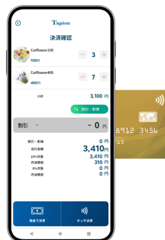
Tapion 決済画面イメージ

なお当社では、生花店・キッチンカーなどは、配達先での出先決済の必要性、端末の防水性など、決済専用端末ではなくスマートフォンの特徴を活かしたタッチ決済ととても親和性が高い業態と考えており、今回のパイロット第二弾の運用を通じ、今後の本格展開に向け機能改善を行なっていく予定です。また引き続き当社では、Tapion プラチナバージョンでのパイロット運用を別加盟店でも実施予定で、「Tapion」によるキャッシュレス決済、及びタッチ決済の普及拡大に努めて参ります。