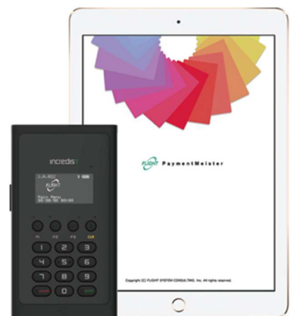
Incredist Premium・ペイメント・マイスター （イメージ）

また亀の井バス様が本社を構える大分県では、2019年9月より開催されるラグビーワールドカップ2019日本大会において、準決勝を含め5試合が予定されています。各国の応援に来訪する訪日外国人向けに、亀の井バス様では特に非接触クレジットカード（正式名称：コンタクトレスEMV、通称：NFC決済/タッチ決済）の対応を重視して端末選定