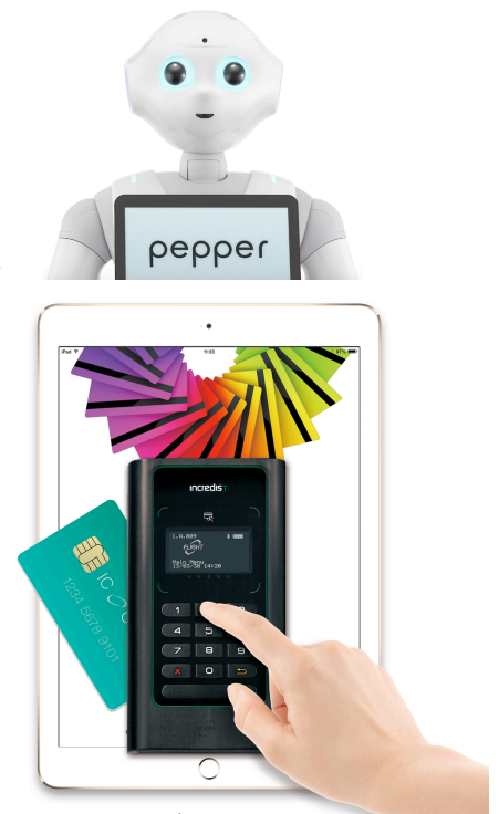
スマートデバイスを活用した 当社決済ソリューション

Pepperによるお客様ヒアリングを通じて、より専門性の高い情報をお望みのお客様、より購買意欲の高いお客様は専門員へ誘導することで、限られた人員の有効活用および効率的な購買までの導線を実現することが可能になり、売上機会の損失を防ぐことが可能になります。