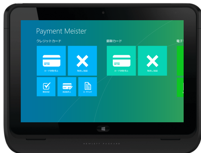
HP社ElitePad+リテールジャケット