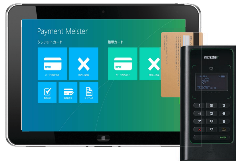
HP社ElitePad+専用端末Incredist (インクレディスト)