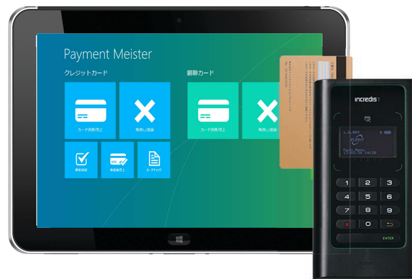
HP社ElitePad+専用端末Incredist (インクレディスト)