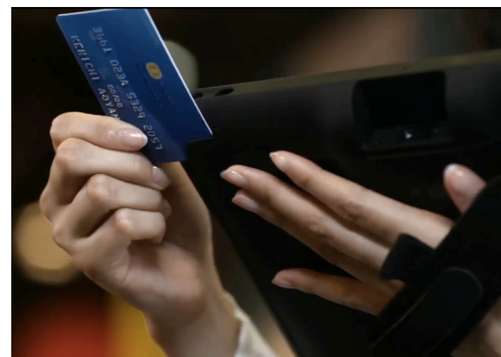
HP社ElitePad+リテールジャケット