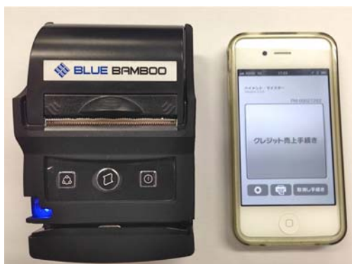
クレジットカード決済システムの使用機器

※ 「ペイメント・マイスター」は、日本クレジットカード協会の「スマートフォン決済の安全基準に関する基本的な考え方」に準拠した安心な決済システムです。